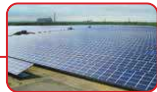
とまこまい 勇払メガソーラー