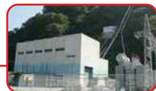
中小水力事業 三峰川発電所・蓼科発電所