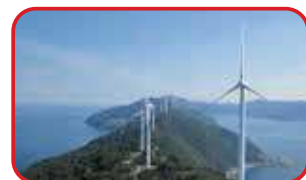
三崎ウィンドパーク

国内17地点にて発電所の建設実績を持つ丸紅グループ。再生可能エネルギーにも注力し、全国各地で水力・太陽光・バイオマス・火力などの発電所を運営しています。